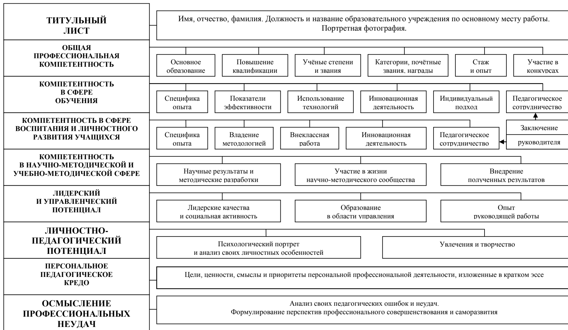
Рис.3. Модель портфолио для педагогического персонала образовательных учреждений.