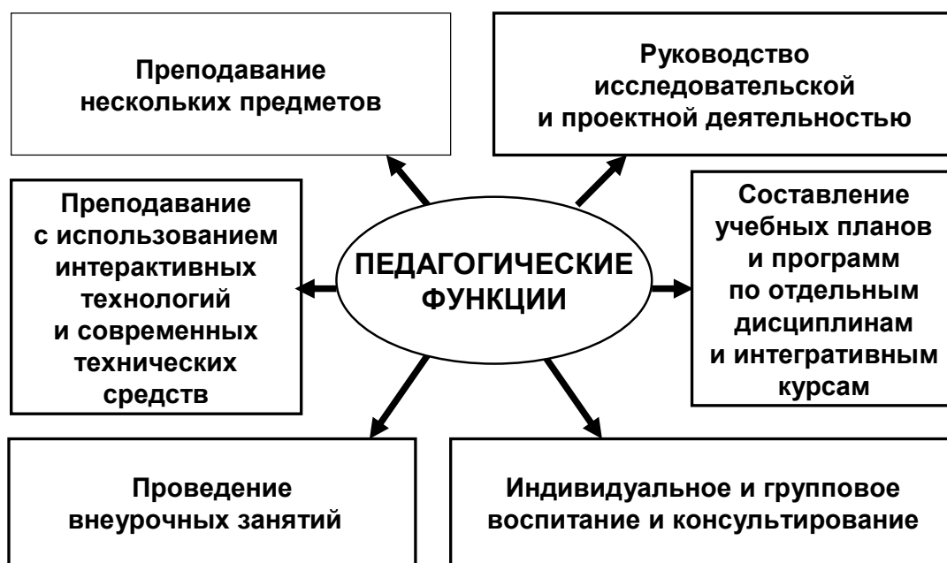
Рис. 1. Педагогические функции в современных образовательных моделях.

Педагоги должны быть солидарны в своих взглядах на смыслы и цели образования. Функционал педагогов включает преподавание нескольких предметов, руководство проектной деятельностью, индивидуальную и групповую воспитательную работу, а также внеурочные занятия и консультирование школьников (Рис. 1.). Таким образом, каждый педагог в равной мере выступает в роли учителя-предметника и наставника-воспитателя.